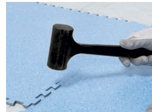
Dalles Attraction® / GTI Max