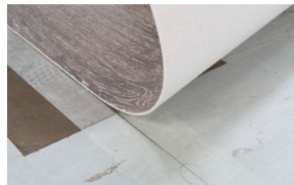
Adhésif Fix and Free 100