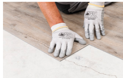
Lames Creation Solid Clic