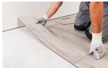
Lames Home Clic